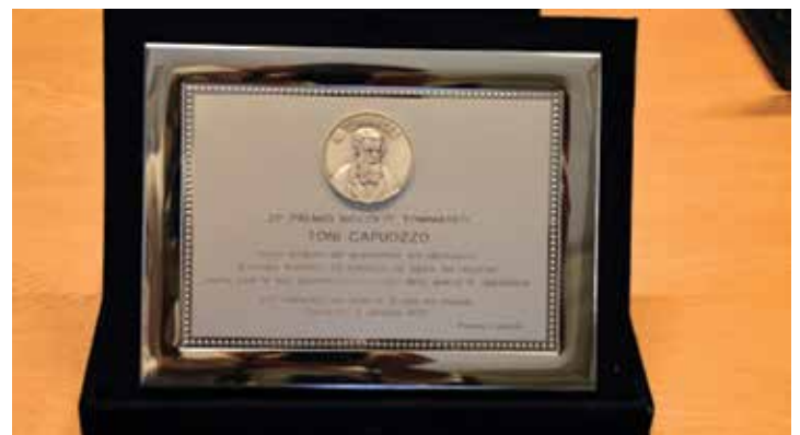
La Targa del 21° Premio Tommaseo