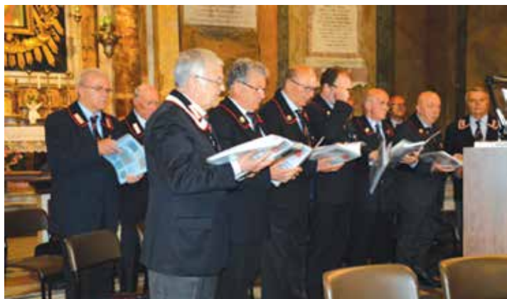
Il coro dei Carabinieri conclude la Messa con il "Va' pensiero"