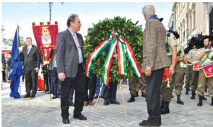
La deposizione della Corona

le Davide Rossi ci ha ricordato l'indimenticabile Lucio Toth ed ha poi tracciato un quadro della situazione italiana nel primo dopoguerra, la nostra mancata partecipazione al referendum del 1946 e l'infausto trattato di Parigi, quel Diktat che ha privato noi e l'Italia delle nostre terre e di cui ricorre questo anno il 70° anniversario