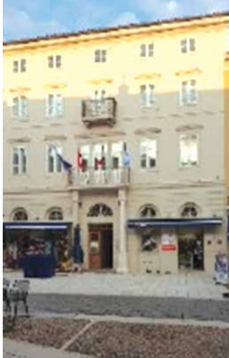
Il palazzo sede della comunità italiana

La sede della Comunità Italiana è in centro, nel bel palazzo recentemente restaurato in piazza Frane Petrica, n. 14. È aperta il mercoledì mattina dalle 9 alle 10. Gli iscritti sono circa 200 tra residenti e una quindicina di onorari, originari chersini