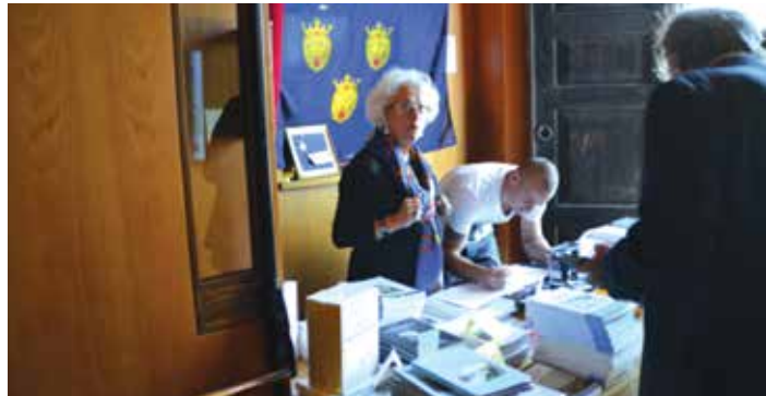
La "Triade del Banchetto", quelli che arrivano prima degli altri e se ne vanno dopo tutti, un panino in piedi e niente palcoscenico con gli applausi del pubblico

Al Consiglio Comunale del pomeriggio era presente, anche questo anno, per un gradito sa-