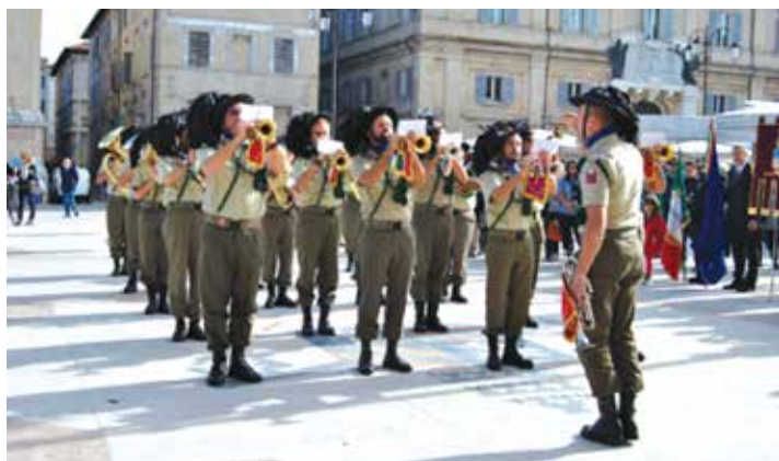
L'applaudita Fanfara dei Bersaglieri

Maschile dell'Associazione Nazionale Carabinieri - Ispettorato Regionale Marche - e si è conclusa con il coro del Va' Pensiero . Il celebrante ha ricordato il nostro esodo ed il nostro patrono san Simon assieme ai patro-